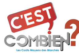
TABLEAU DE L'EVOLUTION DES PRIX DE LA SEMAINE