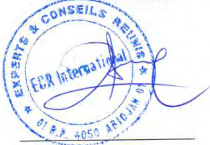
Charles AIE Expert Comptable Diplômé Commissaire aux comptes