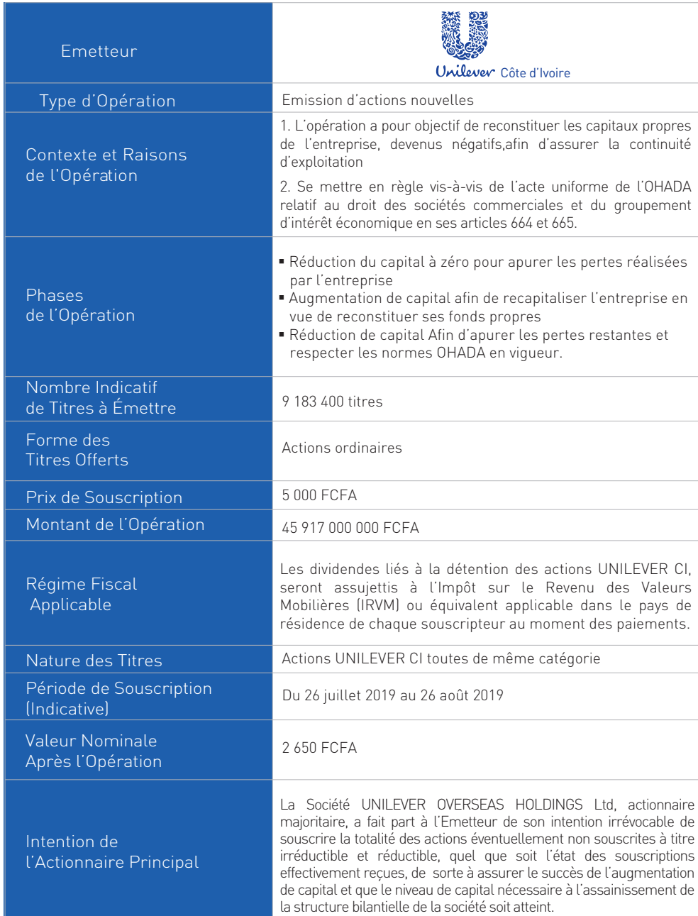
TABLEAU RÉCAPITULATIF DE L'OPÉRATION