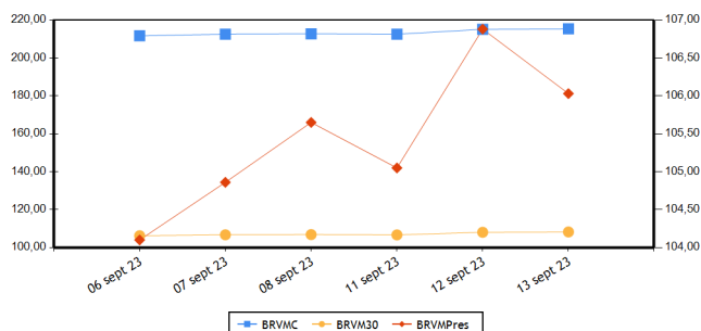
Evolution des indices