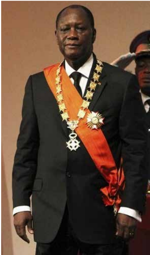
Son Excellence Alassane OUATTARA

Les grandes Nations enseignent au Monde, les itinéraires du progrès, du bien-être social et des valeurs qui interconnectent les composantes de notre culture et de nos richesses.