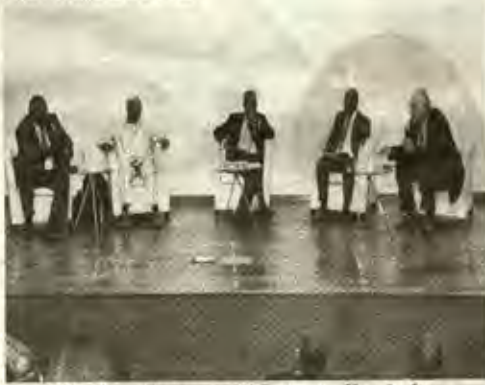
L'Eléphant Vert veut révolutionner l'agriculture ivoirienne

Le forum sur l'agriculture a eu lieu les 13 et 14 octobre à Abidjan. Au cours de cette