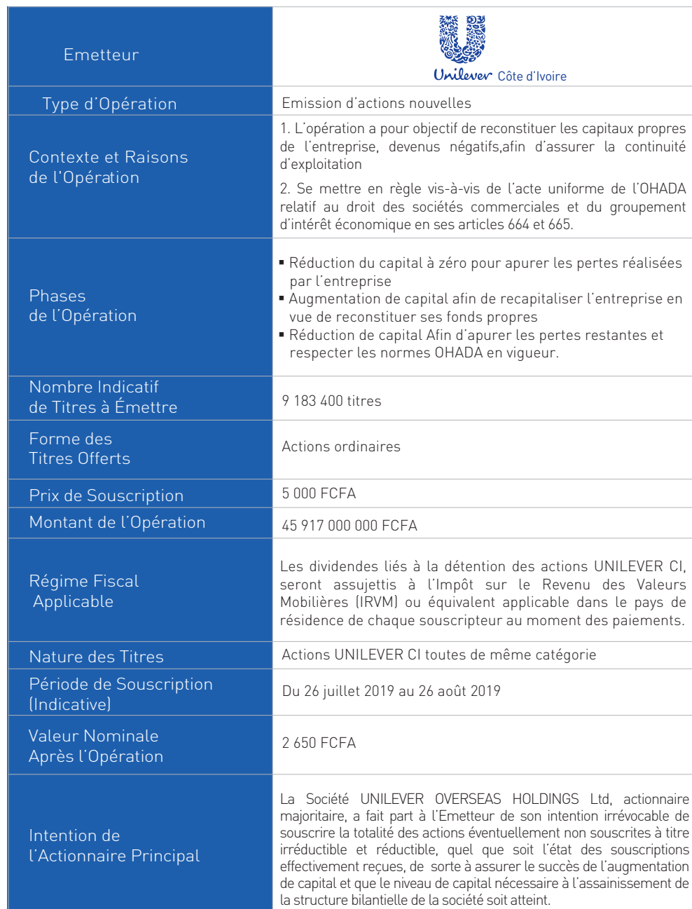
TABLEAU RÉCAPITULATIF DE L'OPÉRATION