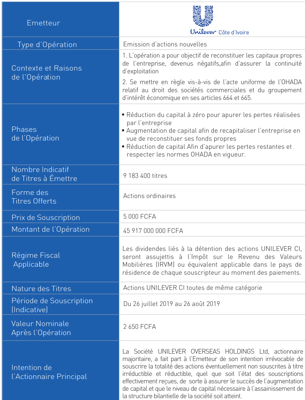
TABLEAU RÉCAPITULATIF DE L'OPÉRATION